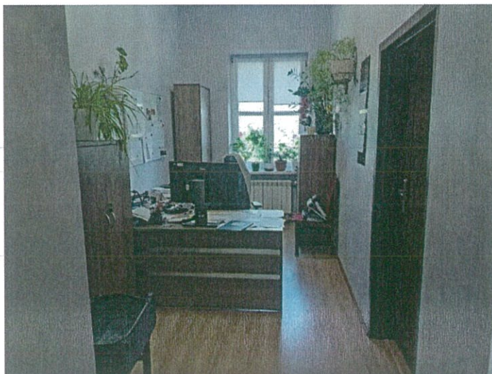
Zdjęcie nr 2 – widok pomieszczenia sekretariatu w Oddziale Przewozów R1.

Miejskie Zakłady Autobusowe Sp. z o.o., 01-710 Warszawa, ul. Włociańska 52